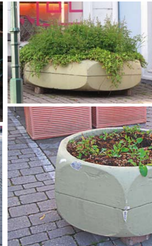
Vier Beispiele von unzähligen: von blühen keine Spur ...