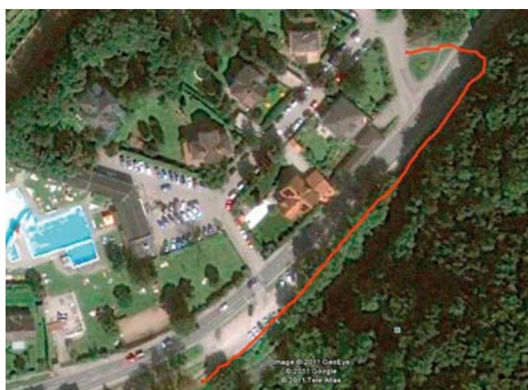
Querung der B44: links Variante 1 mit Querung bei der Marienkapelle, rechts Variante 2: Querung bei der Ampel und Verbreiterung des Gehwegs zu einem kombinierten Geh- und Radweg