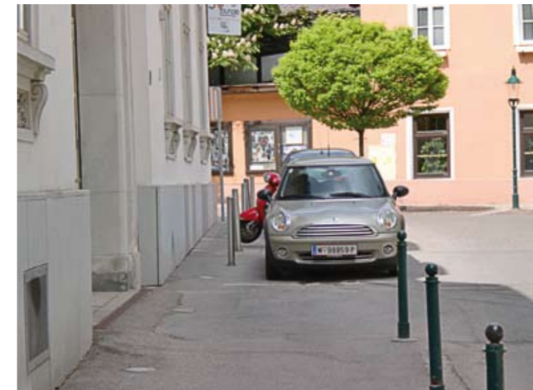
Grund für diesen Schildbürgerstreich: 2 Parkplätze!