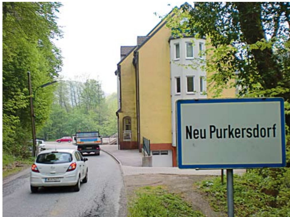
Das Haus Irenental 9 steht jetzt im Ortsgebiet, die Höchstgeschwindigkeit der vorbeifahrenden Autos ist dadurch um 20 km/h vermindert.

D as Haus Irenental 9 beherbergt 18 Wohnungen und liegt direkt an der Landstraße. Bis jetzt galt dort eine 70 km/h-Beschränkung – für die BewohnerInnen zu viel des Lärms und der Gefährdung.