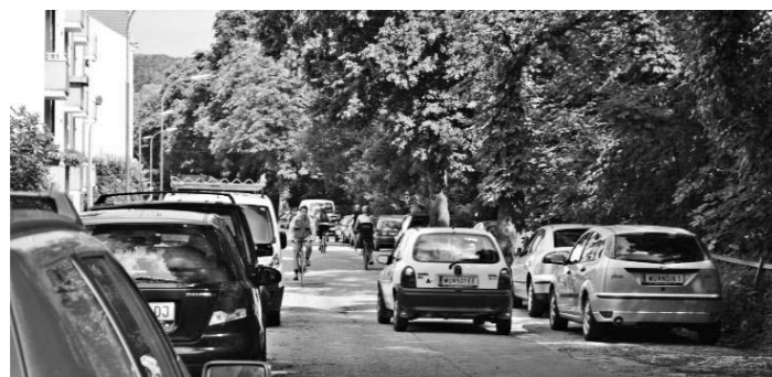
Verparkter Raum als Gefahrenquelle für VerkehrsteilnehmerInnen

die schwächeren, langsameren VerkehrsteilnehmerInnen. Jene Rücksicht, die wir auch von AutofahrerInnen einfordern, sind wir den FußgeherInnen schuldig. Wenn Sie sich von hinten annähern, machen Sie sich bitte frühzeitig akustisch bemerkbar, klingen Sie schon aus der Distanz.