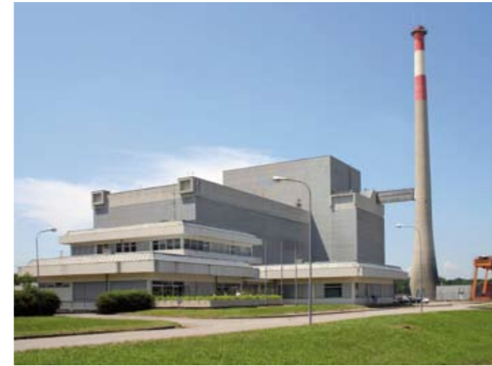
Das sicherste Kernkraftwerk der Welt steht in Österreich

Dieser „Green New Deal“ (Der Begriff ist angelehnt an den „New Deal“ in der großen Wirtschaftskrise in den 30er Jahren in den USA) soll aber nicht hauptsächlich Anlegern helfen. Vor allem die von der Krise stark betroffenen oder bedrohten Schichten sollen wieder in die Gesellschaft hereingeholt werden, indem ihnen eine neue Arbeits- und Qualifikationsperspektive geboten wird. Die Idee ist bereits in großen Teilen der Wirtschaft und der öffentlichen Meinung angekommen. Es reicht ein Blick in Branchengazetten, Messeprogramme oder beliebige Tageszeitungen. Sie alle sind voll von lobenden Beispielen für innovative Ideen, Firmenerfolge und Bildungsbemühungen in umwelttechnischen Branchen. Deutlicher Ausdruck des Durchbruchs der